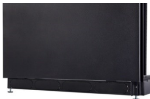
Base soleira construída em aço espessura 1,5mm, acabamento com aberturas para entrada de cabos tipo Knockout e pé nivelador.