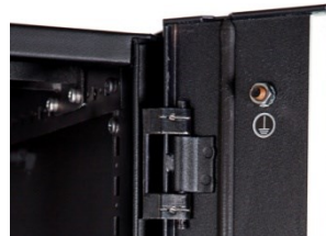
Gabarito para fixação de barra de cobre para aterramento.