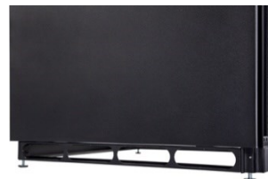
Base soleira construída em aço espessura 1,5mm, acabamento com aberturas para entrada de cabos tipo Knockout e pé nivelador.