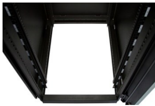
Vista interna da base soleira.