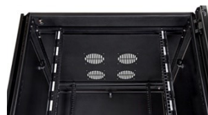
Vista interna do teto dos GP Racks EasyFLEX.