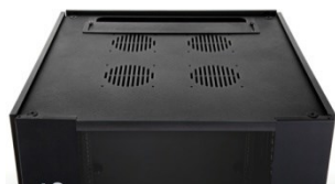
Teto fabricado em aço espessura 1,5mm, aberturas para instalação de até 4 ventiladores e vedação em PU.